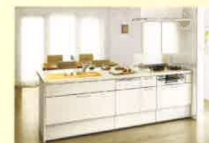
システムキッチン