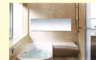
ユニットバスルーム