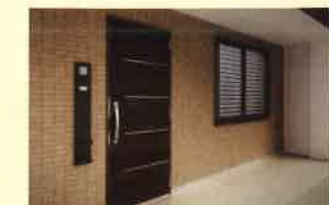
マンション リフォーム用窓・ドア